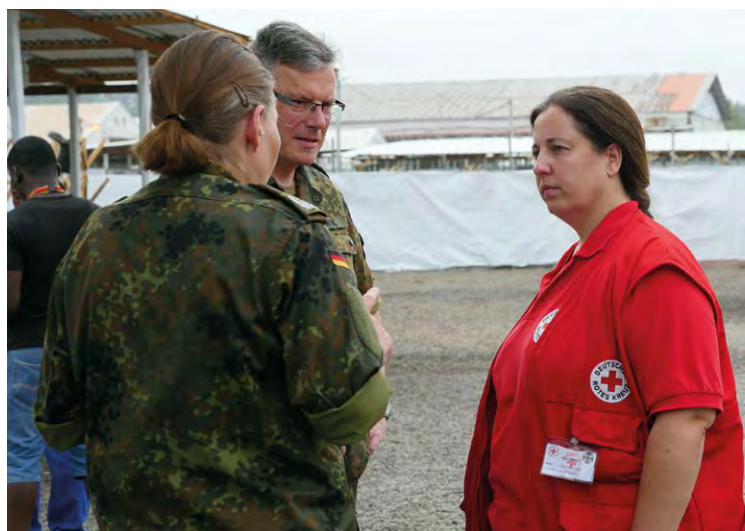
DRK-Mitarbeiterin und Angehörige der Bundeswehr in einem Ebola-Behandlungszentrum in Monrovia, Liberia (Februar 2015)

darf), entspricht eine solche Datenerhebung und -verarbeitung nicht dem Zweck des DRK-Suchdienstes. Dieser hat allein die Sammlung und Verarbeitung von Daten von Betroffenen und Suchenden zur Klärung der Unwissenheit über den Verbleib nahestehender Personen aus humanitären Gründen sowie die Wiederherstellung von Kontakt zwischen diesen Personen zum Ziel. Das DRK muss daher stets dafür Sorge tragen, dass bei seiner Beteiligung in Personenauskunftsstellen unter der Leitung einer Behörde die vom DRK erfassten Daten ausschließlich zu Suchdienst-Zwecken erhoben und verwendet werden. Auch die mögliche Nutzung gemeinsamer Räumlichkeiten, Telefonnummern oder IT-Infrastruktur kann dazu führen, dass die Unabhängigkeit des DRK in Frage gestellt wird. Das DRK-Präsidium nahm daher im April 2015 entsprechende „Leitlinien für die Zusammenarbeit des DRK mit Behörden, insbesondere der Polizei im Personenauskunftswesen nach Landesrecht“ an. Diese sehen u. a. vor, dass die Personenauskunft des DRK ausschließlich zu humanitären Zwecken erfolgen darf, die Unabhängigkeit des