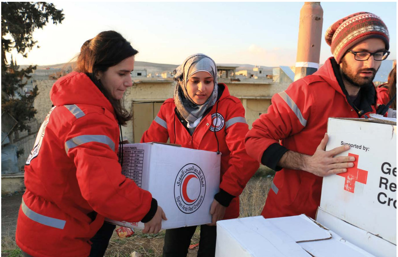
Freiwillige des Syrisch Arabischen Roten Halbmondes bei der Vorbereitung der Verteilung von Lebensmitteln bei Damaskus (2014)

liche religiöse oder kulturelle Haltungen der Mitglieder nicht – den Grundsatz der Neutralität missverstehend – tabuisiert werden. Nicht zuletzt der Grundsatz der Menschlichkeit gebietet gegenseitiges Kennenlernen, Achtung und Toleranz. Dementsprechend steht auch das DRK allen Menschen als Mitgestaltende offen. Dieses „Selbstverständnis“ findet in §1 Abs. 1 Satz 2 der DRK-Bundesatzung bzw. der Mustersatzung für DRK-Ortsvereine Ausdruck.