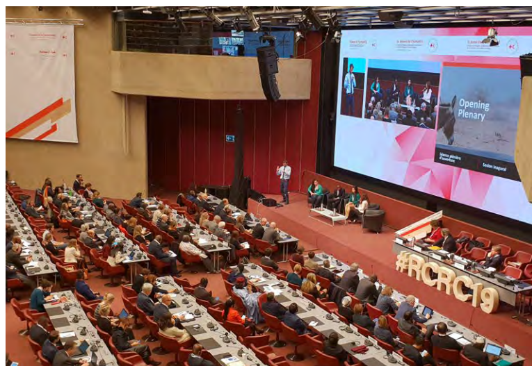
33. Internationale Konferenz des Roten Kreuzes und Roten Halbmondes (Genf 2019)

eigene Programme für das Gemeinwohl, wie etwa in den Bereichen Erziehung, Gesundheit und soziale Wohlfahrt (Art. 3 Abs. 2 Statuten der Bewegung). In Deutschland ist das DRK dementsprechend auch ein anerkannter Spitzenverband der Freien Wohlfahrtspflege und nimmt die Interessen derjenigen wahr, die der Hilfe und Unterstützung bedürfen, um soziale Benachteiligung, Not und menschenunwürdige Situationen zu beseitigen sowie auf die Verbesserung der individuellen, familiären und sozialen Lebensbedingungen hinzuwirken (§ 1 Abs. 4 DRK-Satzung). Im internationalen Bereich ist es Aufgabe der Nationalen Gesellschaften, insbesondere den Opfern von bewaffneten Konflikten, Naturkatastrophen und anderen Notlagen Beistand zu leisten (Art. 3 Abs. 3 Statuten der Bewegung). In Übereinstimmung mit § 2 DRKG nimmt das DRK zudem Aufgaben wahr, die sich für eine Nationale Gesellschaft aus den Genfer Abkommen und ihren Zusatzprotokollen ergeben. Zu diesen Aufgaben zählen somit insbesondere die Unterstützung des Sanitätsdienstes der Bundeswehr im Sinne des Art. 26 des I. Genfer Abkommens, die Verbreitung von Kenntnissen über das humanitäre Völkerrecht sowie die Grundsätze und Ideale der Bewegung, die Wahrnehmung der Aufgaben eines amtlichen Auskunftsbüros nach Art. 122