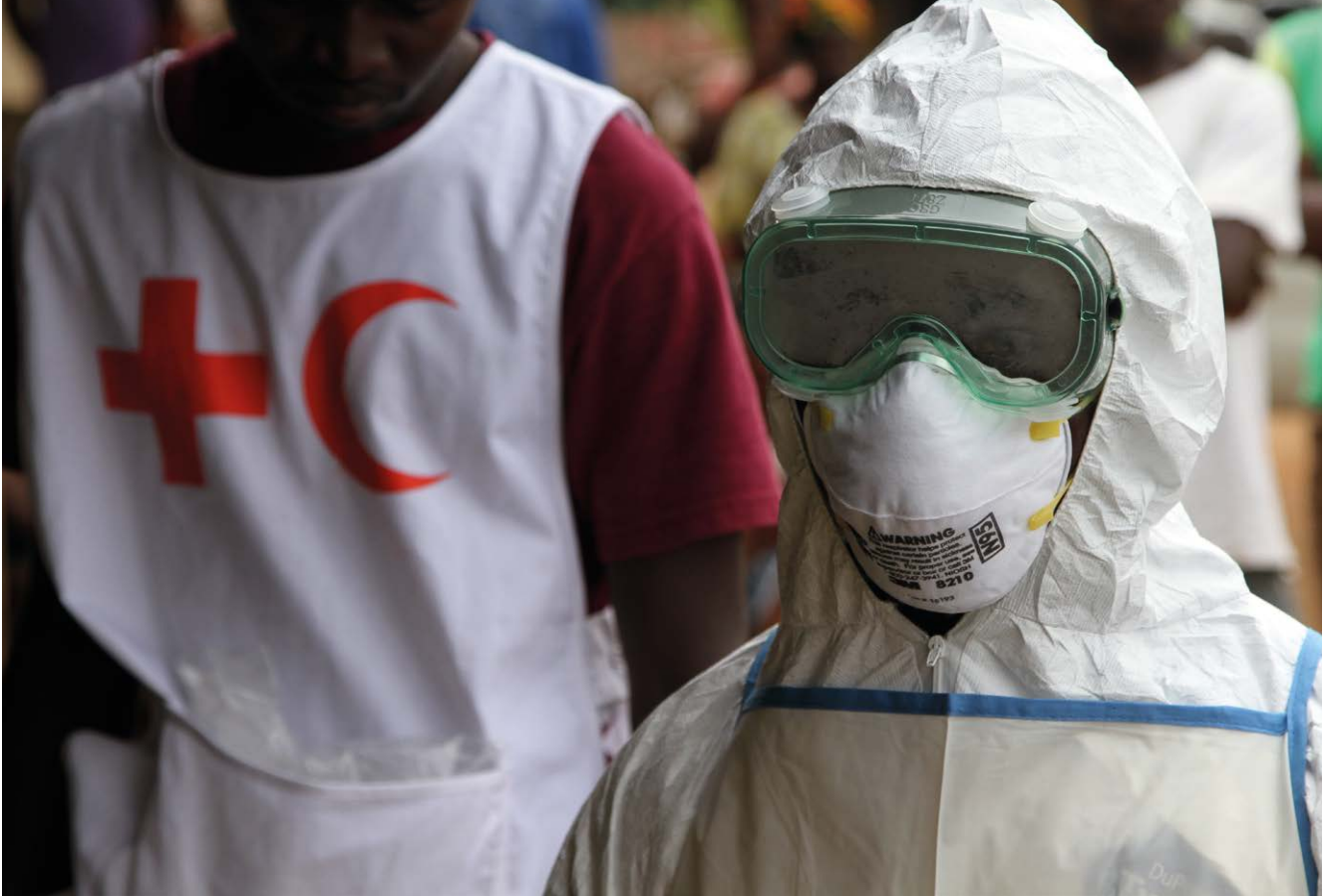
Freiwilliger des Roten Kreuzes von Sierra Leone in Schutzkleidung während des Ebola-Ausbruchs in Westafrika (Juli 2014)

und sozialen Wohlergehens zugrunde, und nicht nur das Fehlen von Krankheit oder Gebrechen. 4 Der Begriff des „Gesundheitsschutzes“ bezieht sich auf alle Maßnahmen auf globaler, regionaler, nationaler und kommunaler Ebene zur Erhaltung, Förderung und Wiederherstellung von Gesundheit. Das Mandat des DRK umfasst somit ausdrücklich nicht nur die Wiederherstellung von Gesundheit, sondern – mit gleichrangiger Bedeutung – auch ihre Erhaltung und Förderung. Die historische Präambel des Grundsatzes der Menschlichkeit erinnert zum einen an die Bedeutung, die dem Gesundheitsschutz als Aufgabengebiet der Bewegung seit ihren Anfangsjahren zukam. Zum anderen macht sie einen sich verändernden Gesundheits(schutz)begriff deutlich, der heute nicht länger auf die Versorgung von in Kampfhandlungen zugefügten Verletzungen begrenzt ist, sondern Maßnahmen bis hin zur betrieblichen Gesundheitsförderung umfasst. Als Zielgruppen von Gesundheitsschutzmaßnahmen kommen sowohl externe als auch interne Gruppen infrage. Dazu zählen Menschen in akuten Notfällen und Katastrophen im Inland; Notleidende und Bedürftige im Ausland; ältere und alte Menschen; kranke und pflegebedürftige Menschen; Kinder, Jugendliche und Familien; Menschen mit Behinderungen und Benachteiligungen sowie Mitarbeitende im Haupt- und Ehrenamt. Das DRK bietet zum Schutz der Gesundheit daher vielfältige Angebote und