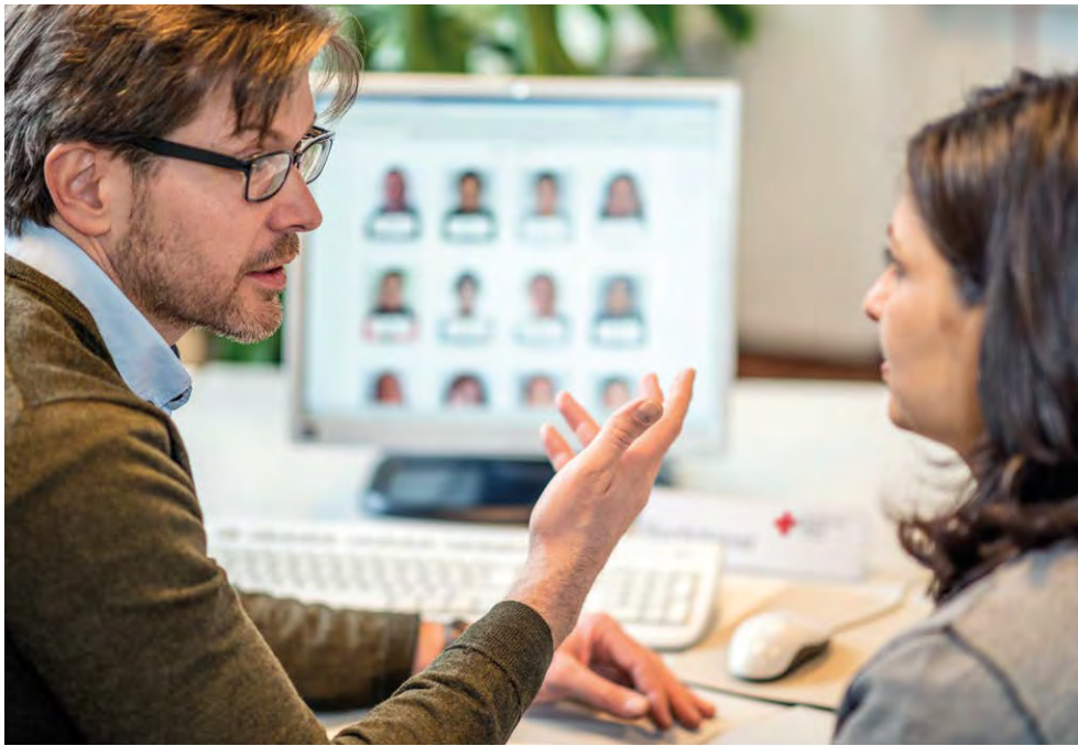
Beratung des DRK-Suchdienstes am Standort Hamburg (2015)

Vertragsstaaten der Genfer Abkommen und die Komponenten der Rotkreuz- und Rothalbmond-Bewegung haben ihr gegenseitiges Verhältnis in einer im Jahr 2007 von der Internationalen Konferenz verabschiedeten Resolution als eine spezifische und eigene Partnerschaft („specific and distinctive partnership“) definiert. 18 Diese Partnerschaft ist durch gegenseitige Verantwortung und Unterstützung gekennzeichnet. Nationale Gesellschaften haben danach u. a. die Pflicht, Anfragen der