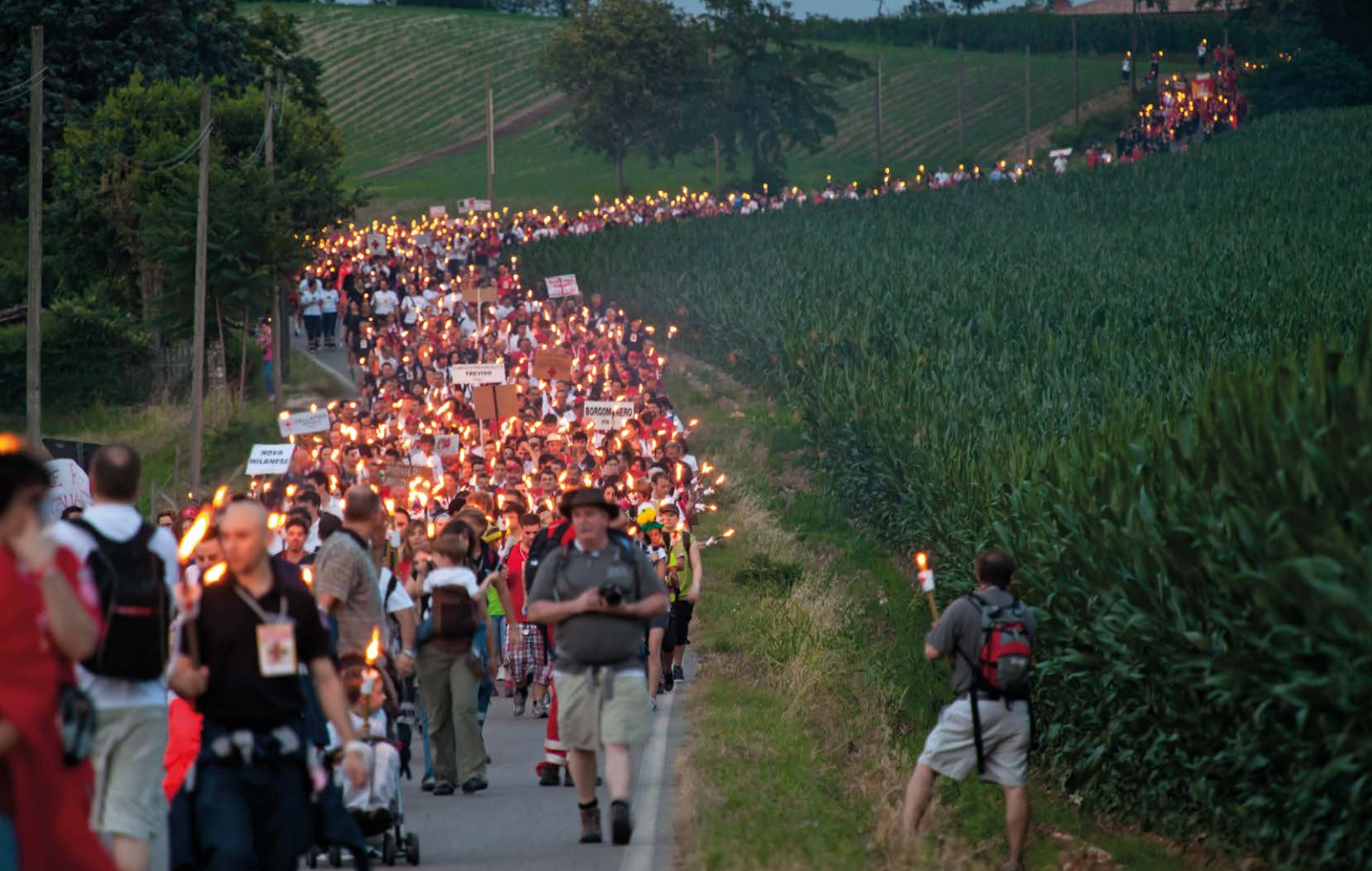
Fackelzug von Solferino nach Castiglione delle Stiviere im Andenken an die Schlacht von Solferino (23. Juni 2012)