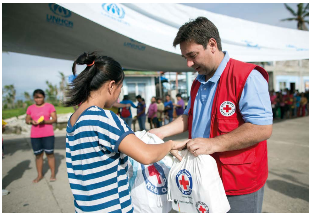
Verteilung von Hilfsgütern in Dulag, Philippinen nach dem Taifun Haiyan (Januar 2014)

Nationale Gesellschaften leisten gemäß ihres nationalen Kontextes und ihrer eigenen Ressourcen unterschiedliche Formen der Unterstützung. Diese umfassen