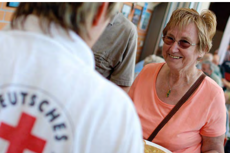
Essensausgabe in einer Sporthalle während des Elbe-Hochwassers (Juni 2013)

Eine weitere Ausprägung des Grundsatzes der Einheit ist das deutschlandweite, interdisziplinäre Zusammenarbeiten im DRK. Zu nennen ist hier insbesondere das sog. „Komplexe Hilfeleistungssystem“ (KHS). Hierbei handelt es sich um ein strategisches Konzept, das von DRK-Präsidium und DRK-Präsidialrat 2005/2006 verbindlich verabschiedet wurde. Kerngedanke ist, die vielseitigen Aufgabenfelder des DRK so miteinander zu verbinden, dass sie für die Bewältigung von Katastrophen aller Art unter einer einheitlichen Führungssystematik nutzbar sind. So kann zum einen den neuen Herausforderungen in der zivilen Sicherheitsvorsorge und der heute deutlich komplexeren Ereignisbewältigung begegnet werden. Dies gilt insbesondere auch vor dem Hintergrund des demografischen Wandels, d. h. mehr alte Menschen, die mehr Unterstützung benötigen, bei weniger einsatzbereiten Kräften. Zum anderen kann das DRK so statt einer nur punktuellen Hilfsstruktur bei Schadenslagen darüber hinaus auch eine dauerhafte Struktur mit umfassenden sozialen und gesundheitsbezogenen Angeboten, die vor und nach der Schadenslage greifen, bieten. Konkret bedeutet dies, dass beispielsweise bei Großschadenslagen nicht nur die Gemeinschaften der Bereitschaften, Berg- und Wasserwacht angesprochen sind, sondern auch das Jugendrotkreuz sowie die Wohlfahrts- und Sozialarbeit und zwar sowohl mit ihrer ehrenamtlichen Gemeinschaft als auch mit ihren über-