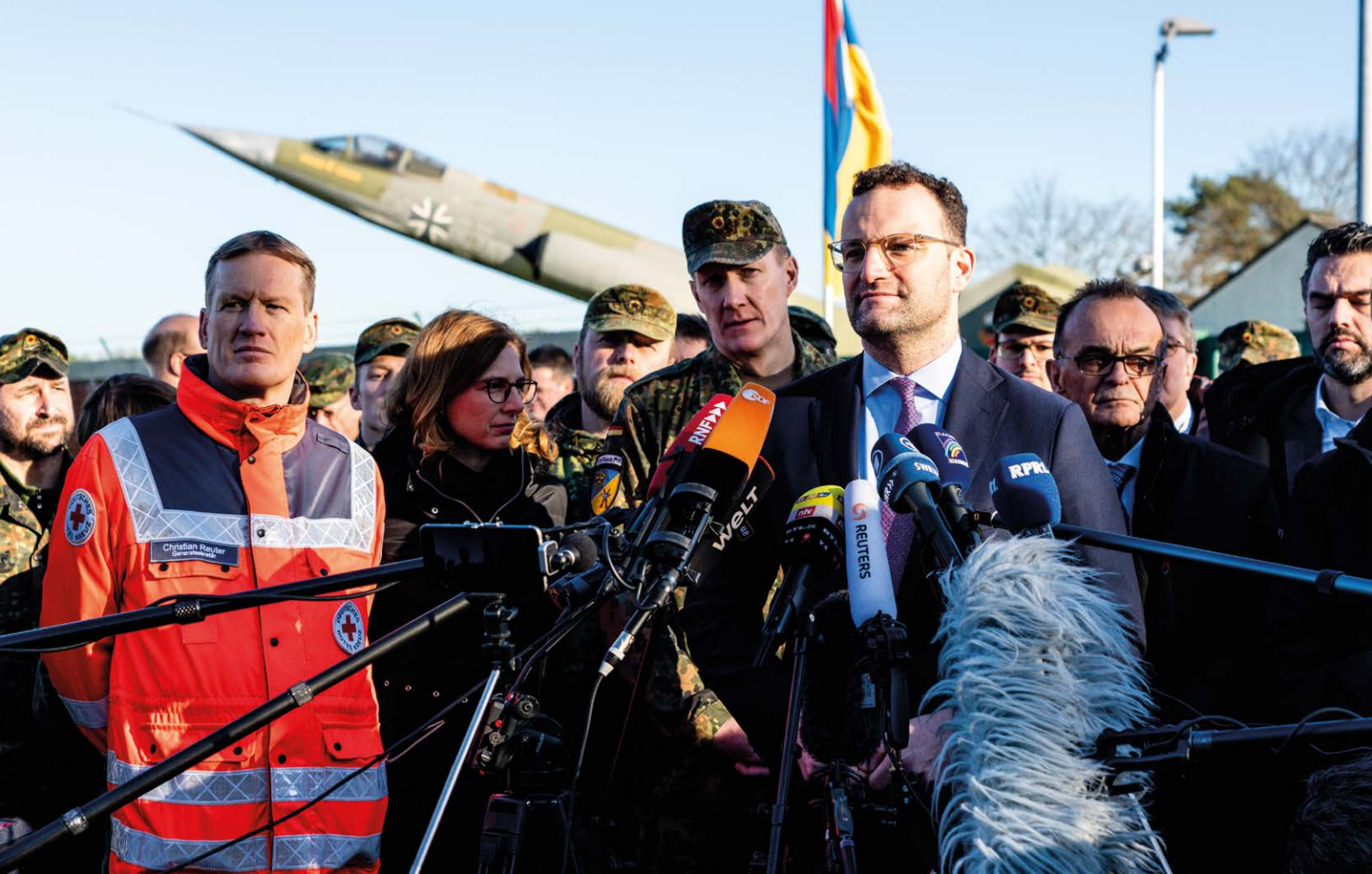
Pressekonferenz des DRK-Generalsekretärs Christian Reuter und des Bundesministers für Gesundheit Jens Spahn in der Südpfalz-Kaserne in Germersheim im Februar 2020