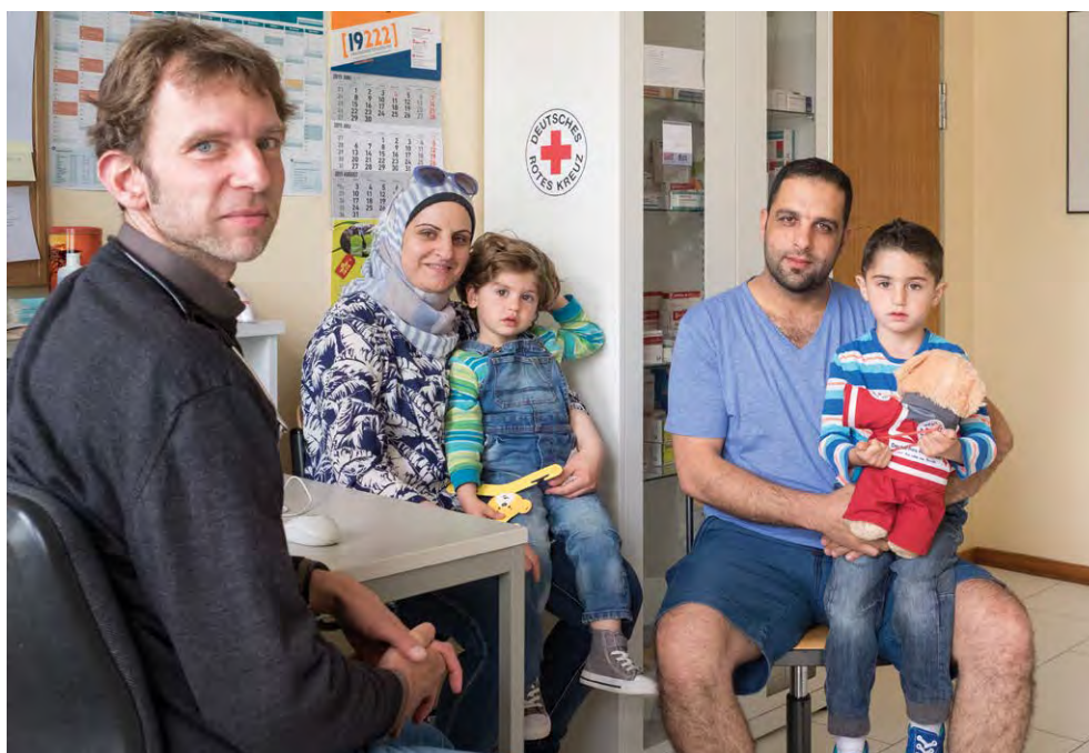
Erstaufnahme für Asylsuchende des DRK-KV Hamburg-Harburg: Geflüchtete beim Arztbesuch (Juni 2015)

Die Internationale Rotkreuz- und Rothalbmond-Bewegung setzt sich im Rahmen ihres Mandates für alle hilfebedürftigen Menschen ein und wirkt Diskriminierung entgegen. Die Liste der nach dem Grundsatz der Unparteilichkeit untersagten Unterscheidungskriterien – d. h. Nationalität, Rasse, Religion, soziale Stellung und politische Überzeugung – ist dabei nicht abschließend. Über die benannten Kriterien hinaus, die häufig Grundlage unzulässiger Diskriminierung sind, ist auch eine Unterscheidung nach sonstigen relevanten Merkmalen, beispielsweise nach Geschlecht, sexueller Orientierung oder gesellschaftlichem Status, unzulässig. 7 Die Verwendung des „Rasse-Begriffes“ wird im DRK teilweise als diskriminierend angesehen und u. a. mit Blick auf die deutsche Geschichte als unangemessen kritisiert. Daher macht das DRK mitunter von der Möglichkeit Gebrauch, auf die Bedenken hinsichtlich der Verwendung dieses Begriffes hinzuweisen und zu erläutern, dass dieser im DRK im Sinne von „Ethnie“ oder „ethnischer Herkunft“ verstanden wird. Eine einseitige sprachliche Veränderung des Grundsatzes durch das DRK ist nicht möglich, da dieser verbindlich durch die Internationale