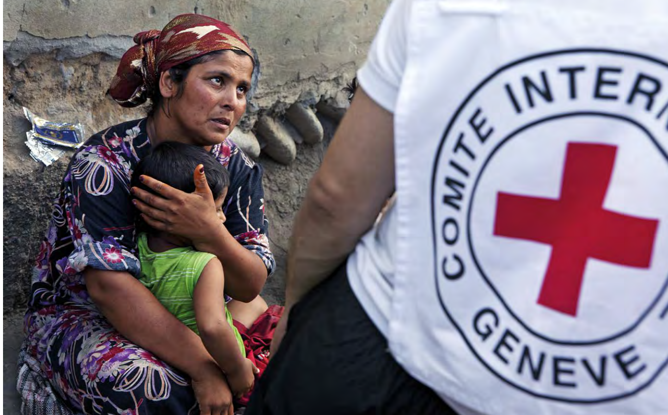
IKRK-Mitarbeiter in Kirgisistan an der Grenze zu Usbekistan (Juni 2010)