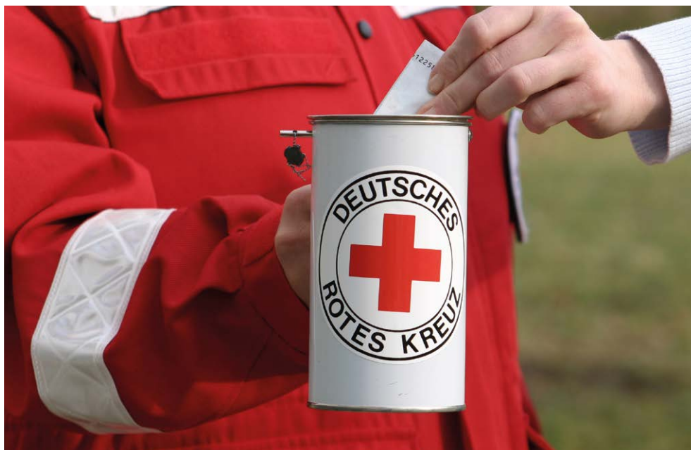
DRK-Spendendose (2010)

tastrophe mit dem Ziel einer möglichst genauen und zeitnahen Lageeinschätzung zum Einsatz. Die vom Sekretariat der Internationalen Föderation in Genf koordinierten „Response Teams“ können innerhalb von 12 bis 24 Stunden aktiviert werden. Auf Grundlage der Berichte dieser Teams werden anschließend, wo nötig und stets auf Ersuchen und nach Priorisierung der lokalen Nationalen Gesellschaft, Beiträge der Komponenten der Bewegung zu einem Hilfeinsatz angefordert und koordiniert. 8 Zum anderen ist die Bewegung bestrebt, dafür Sorge zu tragen, dass hilfebedürftige Menschen im Sinne von „Empowerment“ ihre Bedarfe selber formulieren und einbringen bzw. betroffene Gemeinschaften an Lösungsfindungen beteiligt werden. 9 Für unparteiliche Hilfe ist es unabdingbar, dass nicht nur an einen bestimmten Verwendungszweck gebundene, sondern freie Mittel zur Verfügung stehen. Während im Falle zweckgebundener Spenden oder öffentlicher Mittel selbstverständlich der Spendewille bzw. die Zweckbindung zu achten ist, kann dank freier Mittel sichergestellt werden, dass die Komponenten der Bewegung ihre Hilfe mit der erforderlichen Flexibilität allein nach Ausmaß und Dringlichkeit bestimmter Projekte ausrichten können. Auch kann so in Fällen, in denen die Mittel für bestimmte Projekte sehr ungleich verteilt sind, für einen Ausgleich gesorgt werden und können Opfer von in der allgemeinen Aufmerksamkeit weniger berücksichtigten Notlagen unterstützt werden.