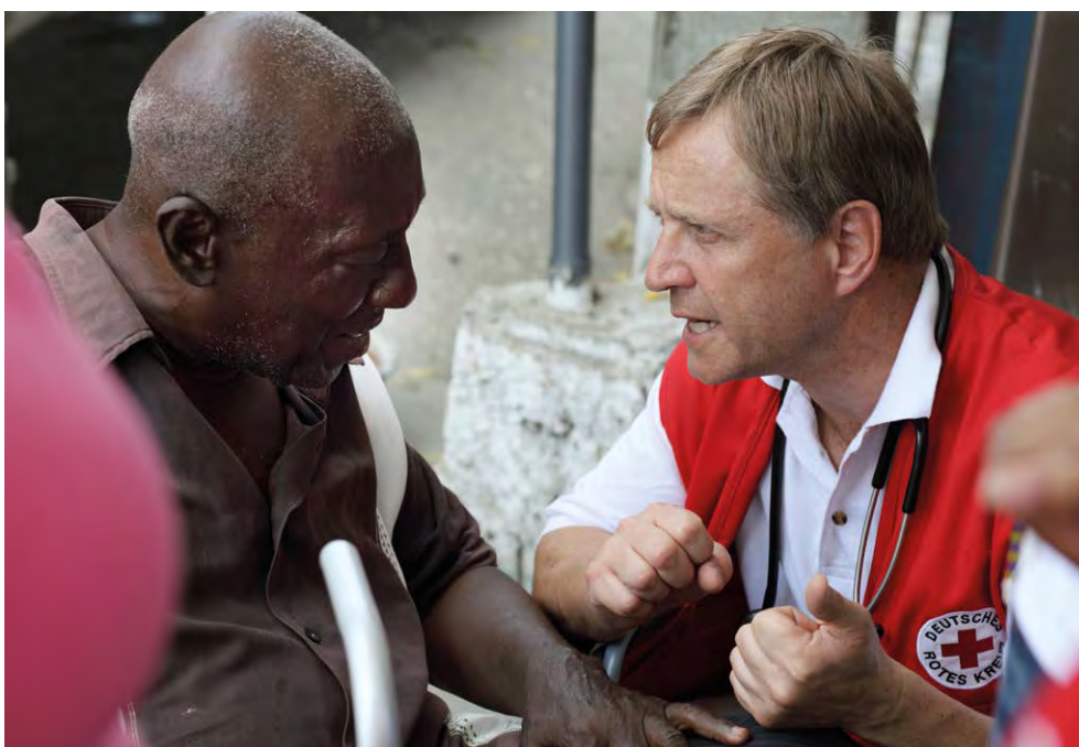
Mobiles medizinisches Team des DRK in Port-au-Prince, Haiti (Februar 2010)

Dem Schutz menschlicher Gesundheit als Teil der Mission der Internationalen Rotkreuz- und Rothalbmond-Bewegung liegt das Verständnis von Gesundheit als ein Zustand des vollständigen körperlichen, geistigen