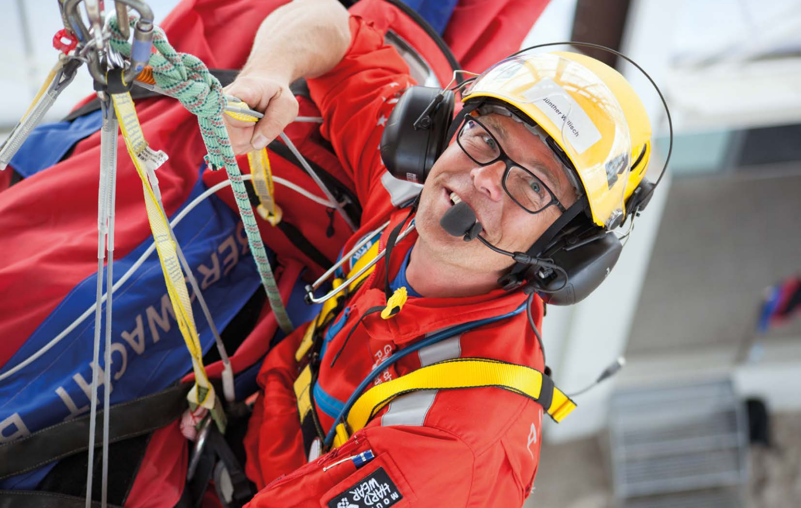
Notfallsimulationstraining der Bergwacht in Bad Tölz (April 2014)

gemeinsamen Hilfe verabredet. Ihr Einsatz war auch für das DRK sehr wertvoll. Das DRK ist daher bemüht, sich künftig besser auf ungebundene Helfende einzustellen, ihre Rolle in bestehende Krisenbewältigungsstrategien zu integrieren und weiterzuentwickeln. Auf Grundlage einer ersten Analyse wurde Lehrmaterial zur Qualifikation der Katastrophenstäbe erstellt. 29