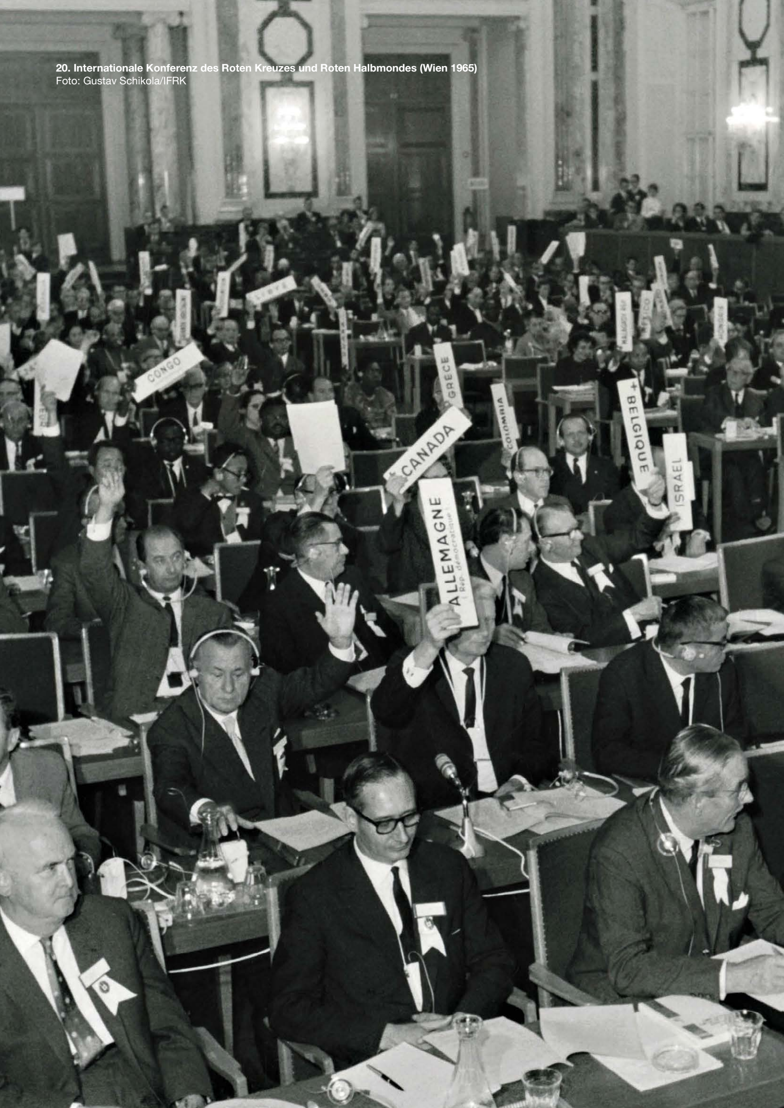
20. Internationale Konferenz des Roten Kreuzes und Roten Halbmondes (Wien 1965)